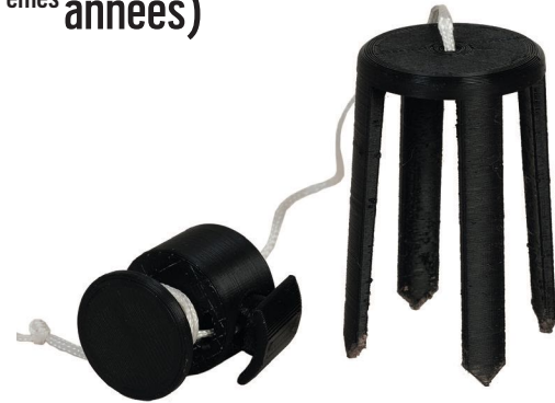
Boule et fil Institut Saint-Joseph - Ciney