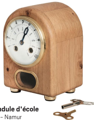
La pendule d'école I.A.T.A. - Namur