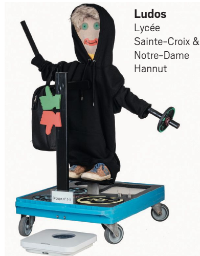
Ludos Lycée Sainte-Croix & Notre-Dame Hannut