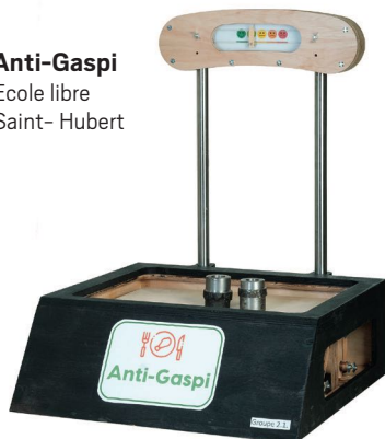
Anti-Gaspi Ecole libre Saint-Hubert