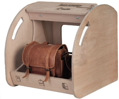
Balancez L'inutile Institut Saint-Joseph DOA - Florennes