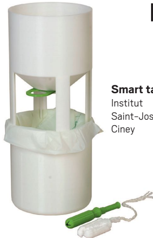
Smart tampon Institut Saint-Joseph Ciney